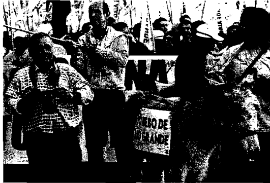
MARCHA. Transcurrió en medio de un ambiente festivo.

A esa idea se sumaron los alcaldes de Coín, Alhaurín el Grande, Cártama, Pizarra, Guaro y Tolox, quienes estuvieron presentes en la cabecera, acompañados