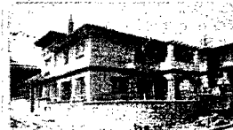
Villas a estrenar, 4 dormitorios, jardín y piscina privada, aire acondicionado, chimenea, cocina amueblada 550.000 € Ref. 1100309