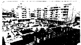
Torre Ataleys, estreno, 3 dormitorios, 2 baños, cocina amueblada y equipada, garaje, trastero 268.048 € Ref. 604420

Maravilloso apartamento a estrenar, con vistas al mar, 2 dormitorios, 2 baños, a/a, terraza, piscina, garaje, jardín privado 302.000 € Milla Oro, apartamento, bonitas vistas al mar, amplios dormitorios, 2 baños, cocina equipada, aire acondicionado, terraza, garaje 275.000 € Marbella centro, apartamento, vistas mar, 3 dormitorios, 2 baños, cocina amueblada y equipada, terraza, garaje, piscina 320.000 € Marbella oeste, promoción, apartamento 3 dormitorios, 2 baños, terraza, cocina equipada, garaje, piscina 268.000 € Ático dúplex, fantásticas vistas al mar, 3 dormitorios, 3 baños, 3 terrazas, aire acondicionado, garaje, cerca del mar 572.000 € Arco de Marbella, adosada en inmejorables condiciones, 3 dormitorios, 2 baños, terraza, sótano, solarium y parking privado 350.000 €