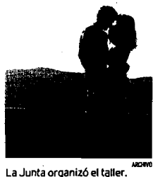
La Junta organizó el taller.

ALMARGEN Este municipio acogió el pasado fin de semana un taller de sexualidad para informar a los jóvenes sobre los riesgos de enfermedades de transmisión sexual, como el sida.