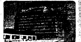
Marbella playa, dúplex con vistas mar y puerto pesquero, amplios dormitorios, 2 baños, barbacoa en terraza, garaje, trastero, piscina 280.000 € Ref. 1608477

Málaga - Fuengirola - Riviera - Marbella - Puerto Banús - San Pedro Alcántara - Estepona - Manilva - Ronda