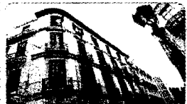
Ático en centro histórico, reformado, calidades de lujo, 2 dormitorios, cocina amueblada, a/a, tarima flotante, 12 metros de terraza 331.210 € Ref. 604301