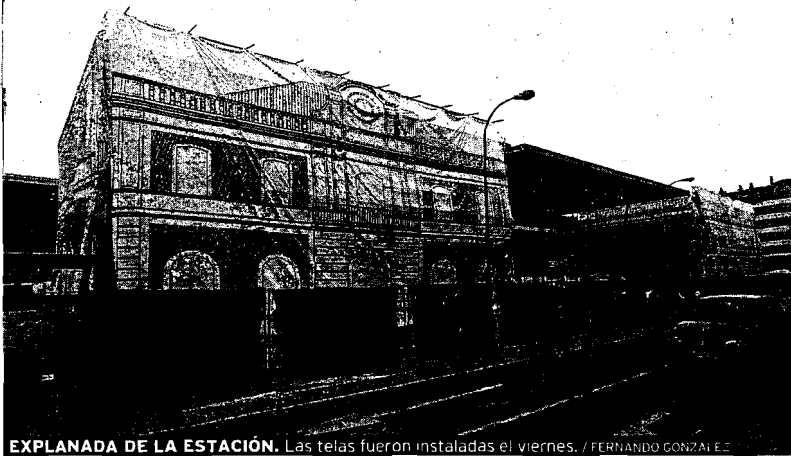
EXPLANADA DE LA ESTACIÓN. Las telas fueron instaladas el viernes.

Todo está preparado para la inauguración de la nueva estación, denominada 'María Zambrano', mañana lunes. Hasta el más mínimo detalle se ha tenido en cuenta: el antiguo edificio de la estación ha sido cubierto este fin de semana con unas grandes telas que representan el futuro diseño de la estación. Con esta medida, se mejora provisionalmente la imagen de este inmueble, que está llamado a ser uno de los referentes de la ciudad de Málaga para los próximos años.