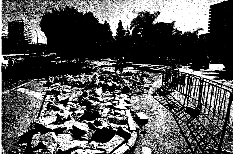
PUENTE DE LAS AMÉRICAS. El Consistorio ha desmontado isletas para el vial.

Estas obras se enmarcan dentro del proyecto de carril bus en los dos laterales de la avenida de Andalucía, que ya se encuentra ejecutado en varios tramos. Según las fuentes de la EMT, esta obra quedará finalizada al completo para el próximo mes de diciembre, desde la glorieta de Manuel Alcántara hasta la altura de la calle Pedro Gómez Chaix.