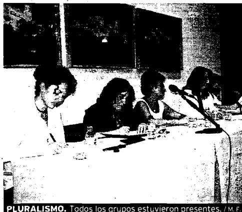
PLURALISMO. Todos los grupos estuvieron presentes. / M. F.