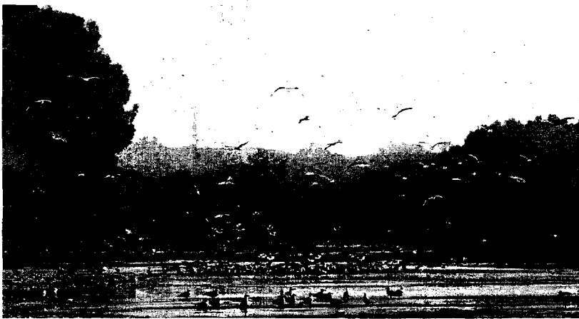
RÍO GRANDE. Los ecologistas aseguran que se perderían varias especies de aves.